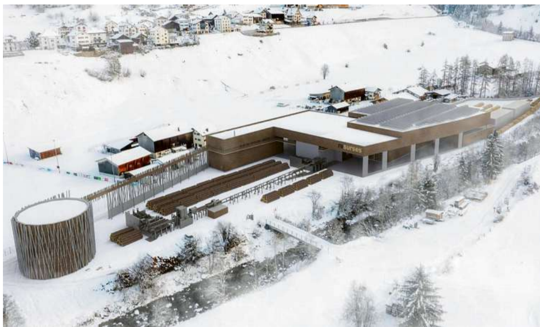
Blick in die nahe Zukunft : So soll sich das Areal der geplanten neuen Resurses-Sägerei in Tinizong ab Dezember 2022 präsentieren.